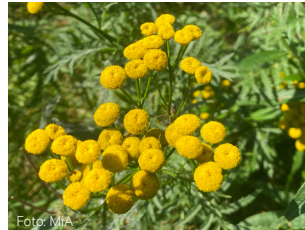
Reinfann Tanacetum vulgare