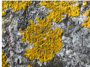
Vanlig messinglav Xanthoria parietina