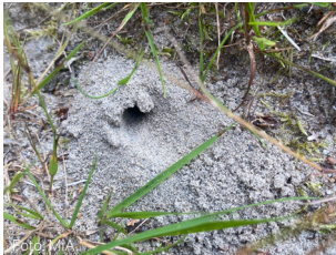
Hull etter sandbie