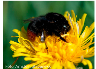
Steinhumle Bombus lapidarius