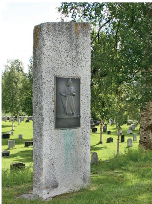
Minnesteinen ved Vingelen kirke.

Foten er bygd av små, runde steiner som symboliserer Saras venner. Over er det plassert en kvernstein som skal minne om haugianernes nære kontakt med jord og natur. Øverst står det en rundslipt naturstein som uttrykker evighetsperspektivet i deres ånd.