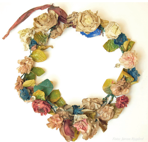
Saras brudekrans.

Brudekransen består av blomster av silkepapir og tekstiler, sannsynligvis såkalte Nürnberggroser samt glassperler. Den har rester etter et silkebånd som ble brukt til knyting. Brudekranser av denne typen er kjent både fra Tolga, Os, Røros og enkelte andre steder i landet. Kranser ble stadig mer utbredt på 1800-tallet. Den kan ha blitt kjøpt på Røros eller i Trondheim. Norsk institutt for bunad og folkedrakt sier at det hører med til unntaket at det foreligger så mange opplysninger om eieren som i dette tilfellet. Ifølge Anno Musea i Nord-Øster-