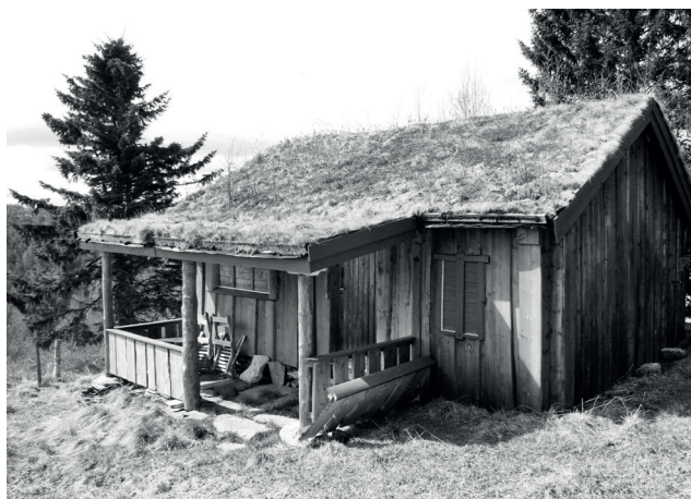
Nordvangsvollen, Oustutroås vårseter, der noen av møtene ble holdt.

I tiden etter den første generasjonen med haugianere forsvant de kvinnelige predikantene. Mange av kirkens menn uttalte