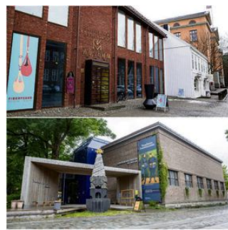
Nordensfjeldske Kunstinstrimuseum og Trondheim kunstmuseum.