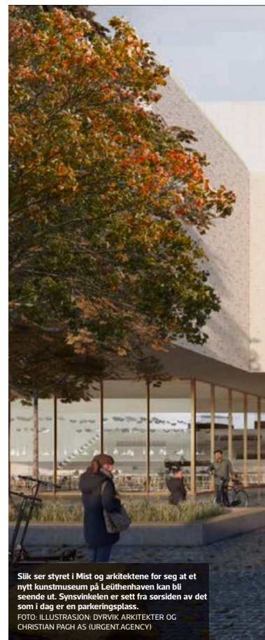
Slik ser styret i Mist og arkitektene for seg at et nytt kunstmuseum på Leithenhaven kan bli seende ut. Synsvinkelen er sett fra sorsiden av det som i dag er en parkeringsplass.