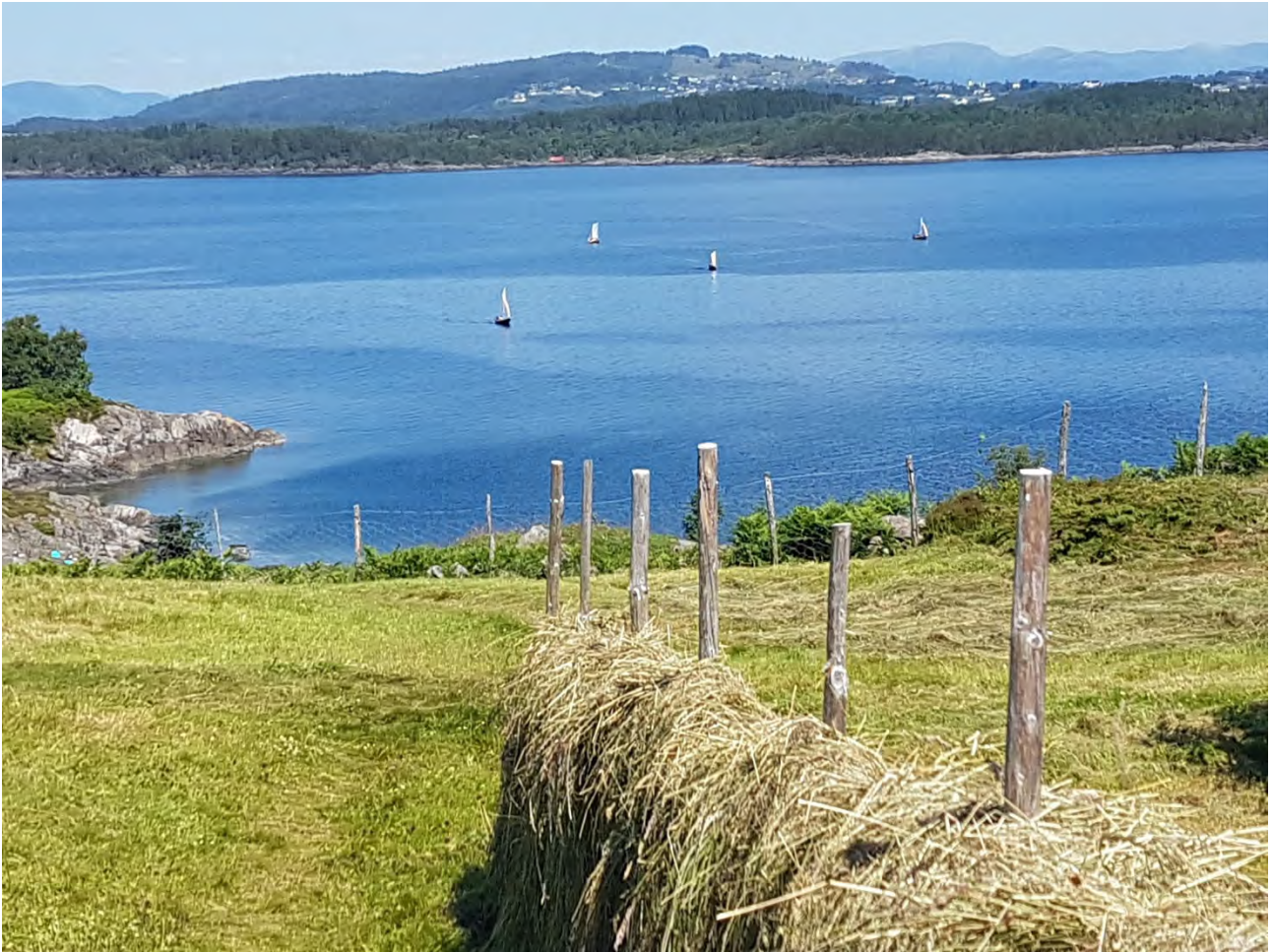
Sommarskule Lygra Juni 2021