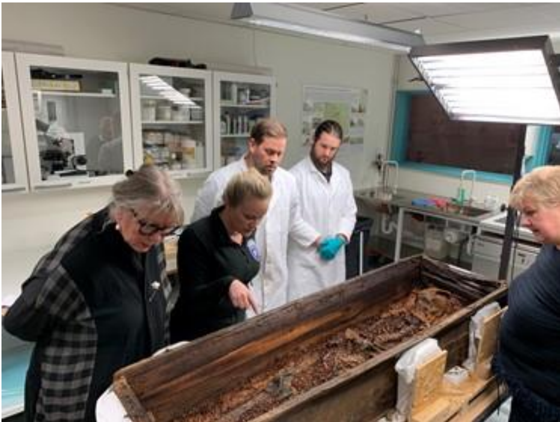
Statsminister Erna Solberg besøkte Svalbard Museum 26. februar 2020