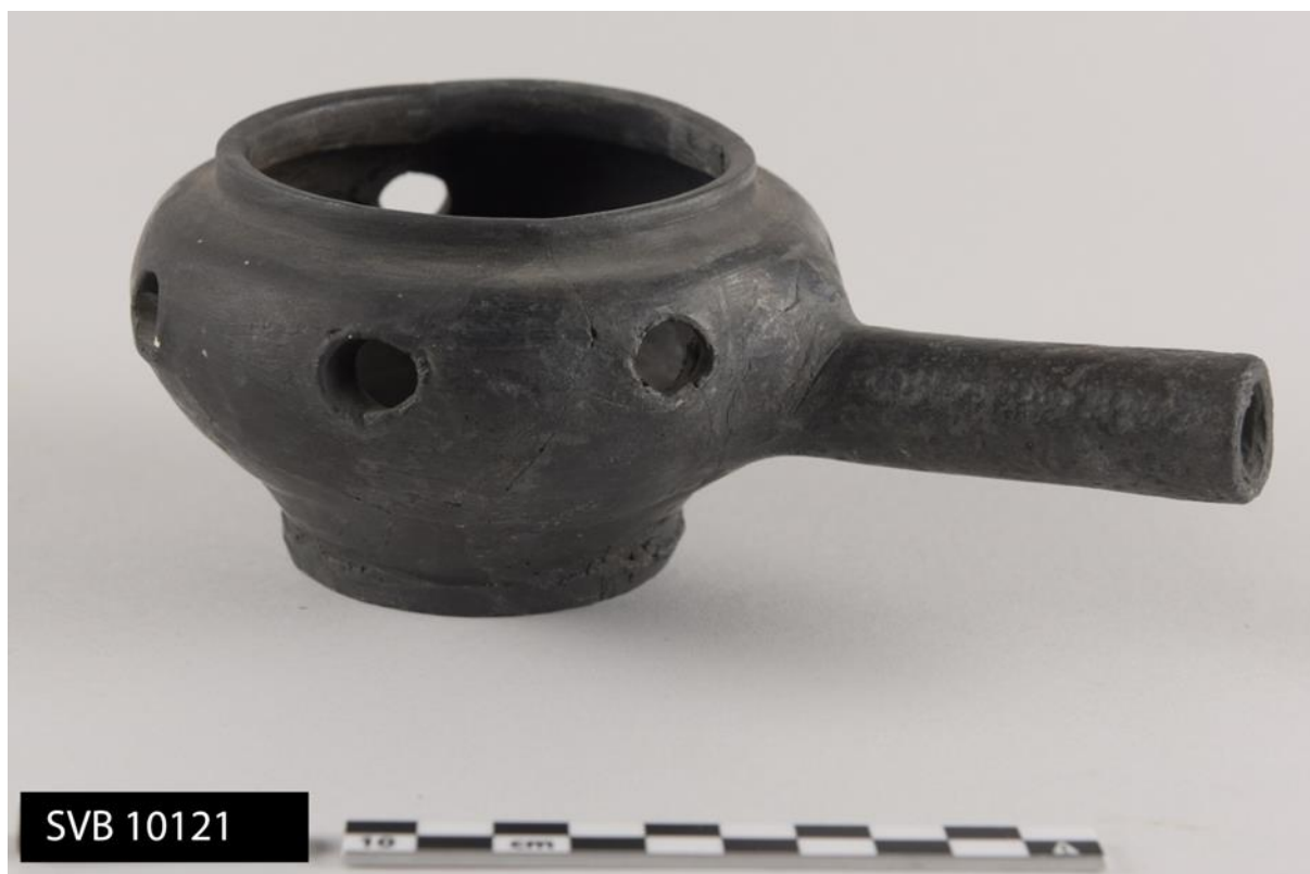
Oljelampe av keramikk fra russisk fangststasjon fra 1700-tallet

medfører at Svalbard Museum har oversikt over gjenstandsmateriale fra de russiske arkeologiske utgravningene på Svalbard. I dette prosjektet samarbeidet vi med Det russiske vitenskapsakademi i Moskva sin arktiske arkeolog Viktor Deshavin og med Trust Artikugol i Barentsburg.