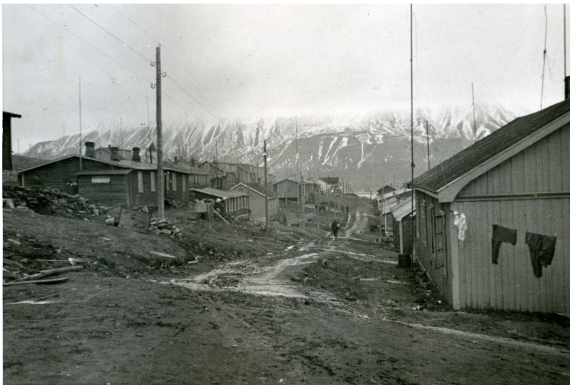
Longyearbyen 1941 Fra Jens A. Bays album tilvekst 2020