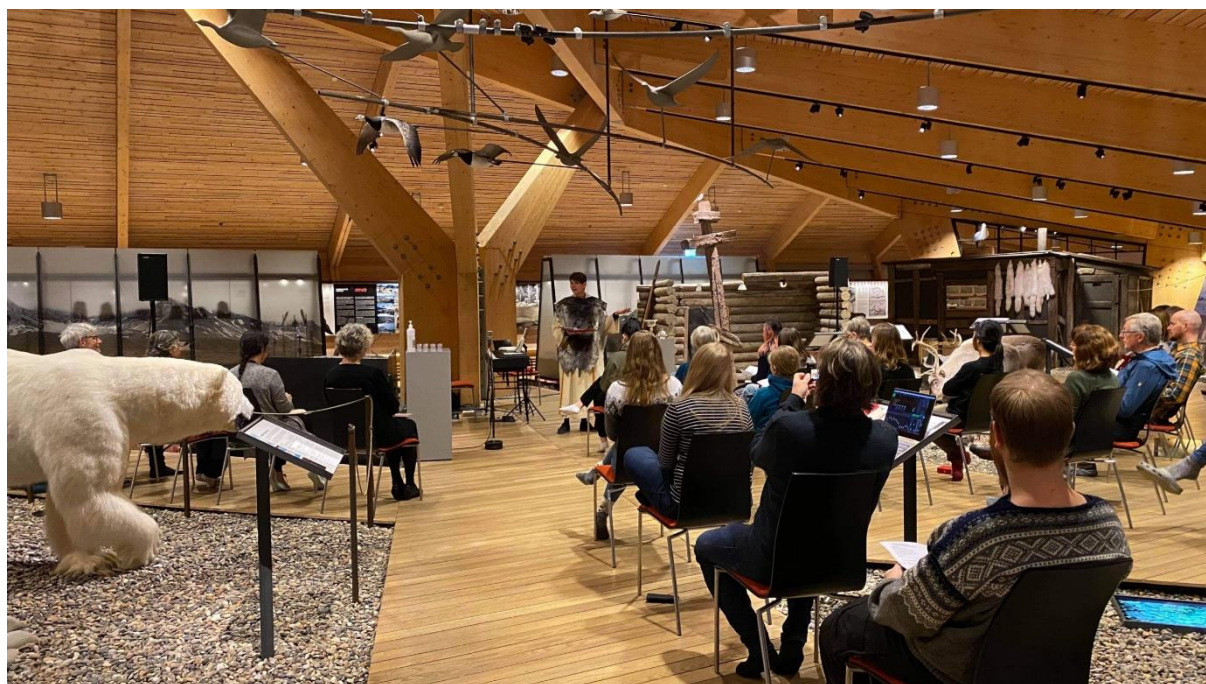
Gudstjeneste på Svalbard Museum 1. november 2020

Svalbard Museum har hatt åtte ulike arrangementer i løpet av 2020.