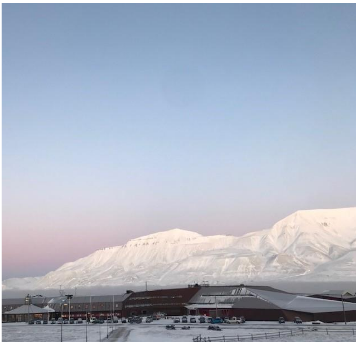
Svalbard Museum er lokalisert i Svalbard Forskningspark

Museet er lokalisert i Svalbard Forskningspark. Fra 2011 overtok Stiftelsen Svalbard Museum ansvaret og driften av Sysselmannens kulturhistoriske magasin som har vært samlokalisert med Svalbard Museum i Svalbard Forskningspark siden 2005. Sysselmannens kulturhistoriske magasin er derfor historie og Svalbard Museum er utvidet med en hel etasje i D-fløya i Svalbard Forskningspark. Utvidelsen omfatter et klimaregulert gjenstands- og fotomagasin, tørr- og