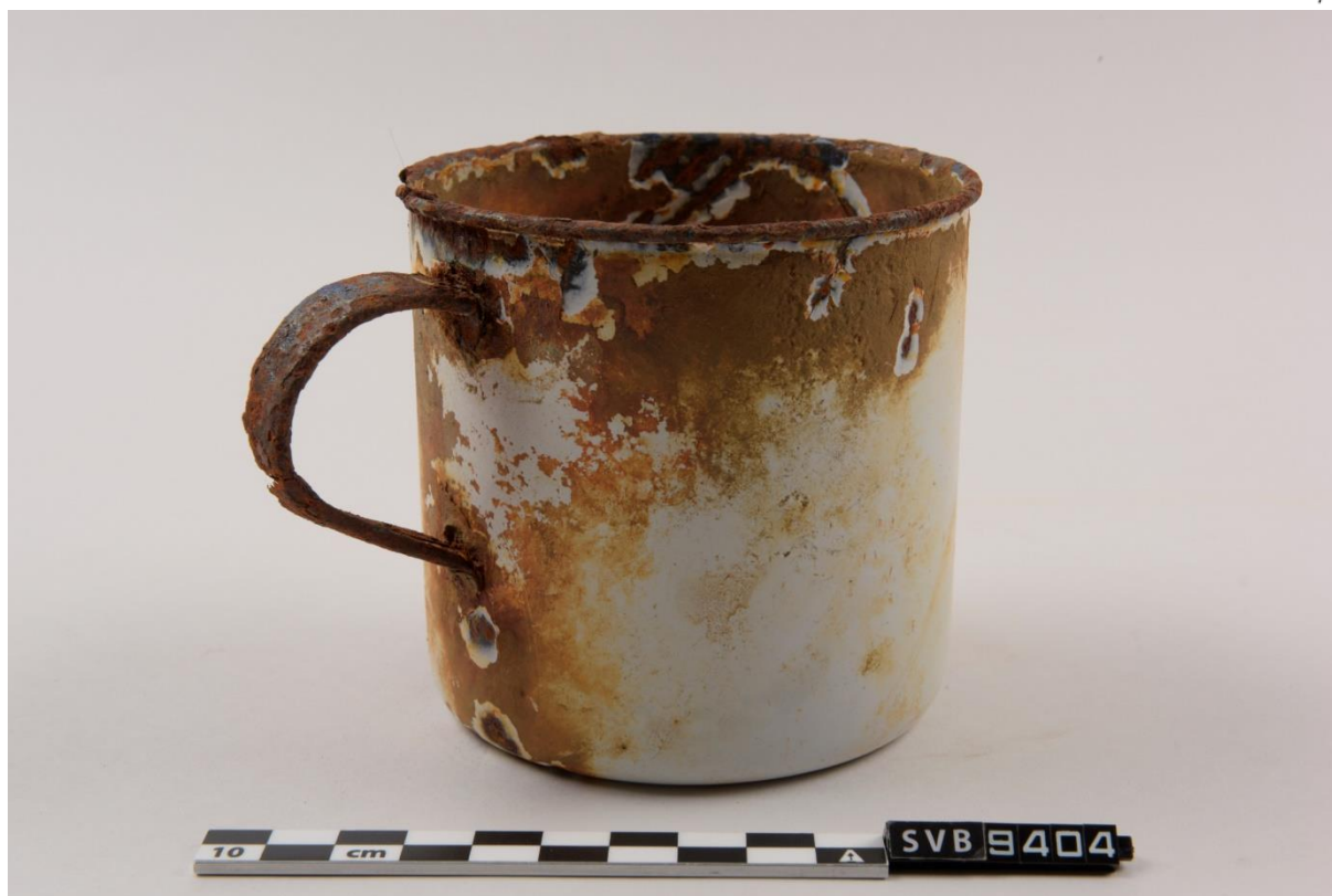
Kopp fra Sveagruva