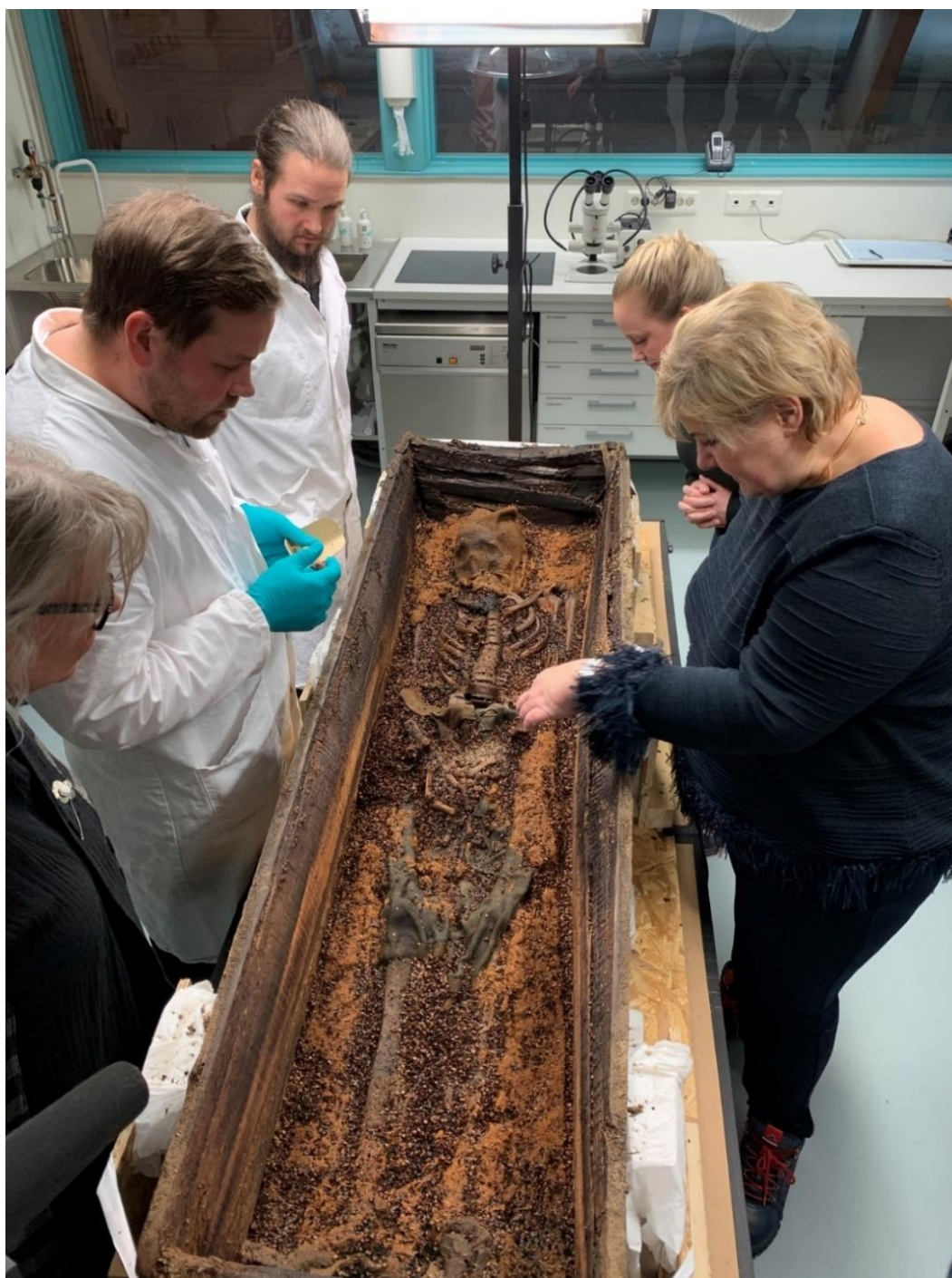
Statsminister Erna Solberg studerer kvalfangerskjelettet under utgravning på Svalbard museum 26. februar 2020

Et viktig arbeid i 2020 har vært utredninger, feltarbeid og kulturminneoppgaver som har vært bestilt fra miljøavdelingen ved Sysselmannen på Svalbard. Dette gjelder registrering av fredete gjenstander på fangststasjonen Kapp Wijk og kontrollregistreringer samt overvåkning av fredete kulturminner i Svea. I tillegg har Svalbard Museum bidratt til planlegging og gjennomføring av to arkeologiske utgravninger: utgravninger av tre kister fra Likneset i løpet av februar 2020 og utgravning av en mødding (avfallshaug) i Russekeila en uke i september.