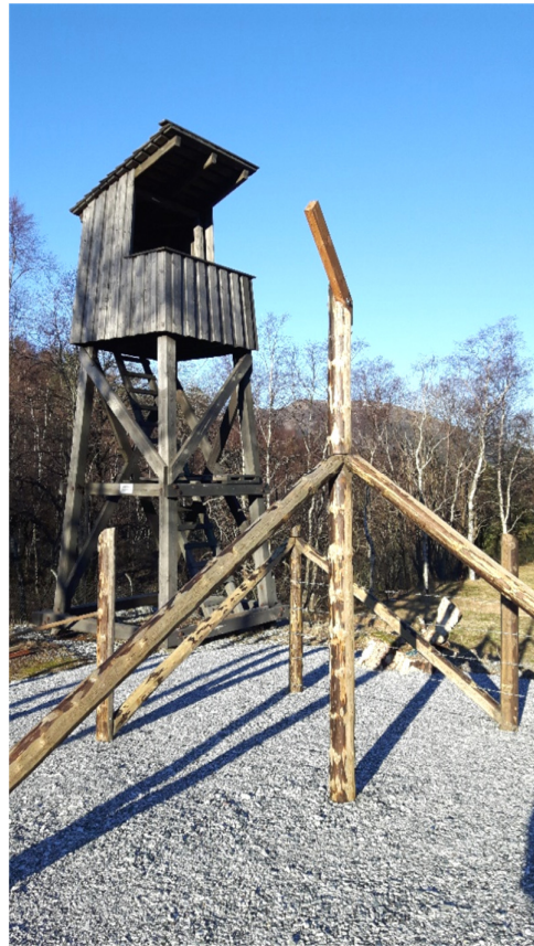
Rekonstruksjonen av piggrådgerdene tar form.

Stiftelsen Espeland fangeleir ble stiftet 13. januar 2000, og i januar 2015 kom hele leiren i stiftelsens eie. Leiren brukes i dag i første rekke som et museum, og besøkes av en rekke skoler, organisasjoner og privatpersoner.