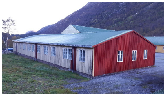
Store arbeider er nedlagt på Brakke 2 og mye gjenstår.