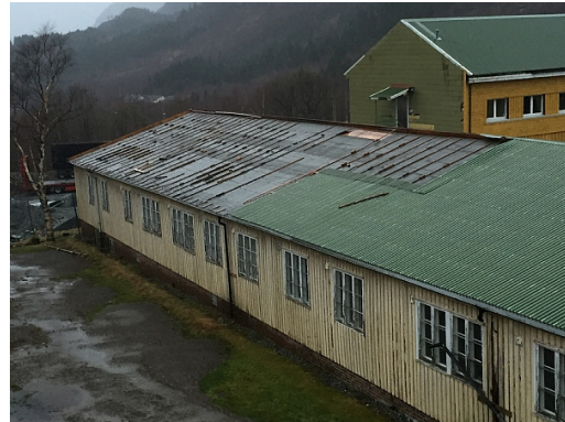
Nyttårsstormen blåste vekk taket på Brakke 2.

Nyttårsstormen ga stiftelsen en voldsom start på året, da store deler av taket på Brakke 2 ble revet av. Bygget var heldigvis forsikret. Restaurasjonsarbeidene på bygget har preget mye av året.