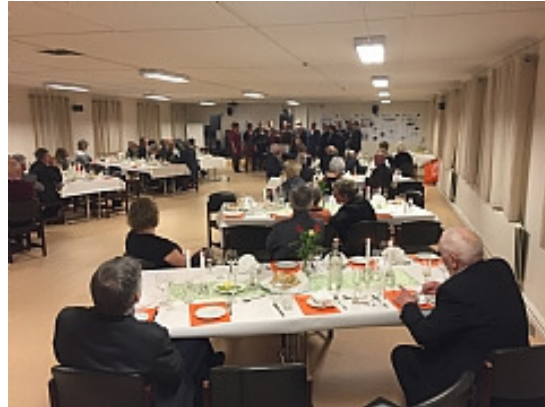
Trengereidkoret feirer sitt 30 års jubileum i Kvinnebrakken i regi av Venneforeningen.

Styret i stiftelsen vil takke alle medlemmene i Venneforeningen som har stilt opp og hjulpet til, samt alle støttemedlemmer. Uten disse bidragene ville det ha vært uhyre vanskelig å drive Espeland fangeleir.