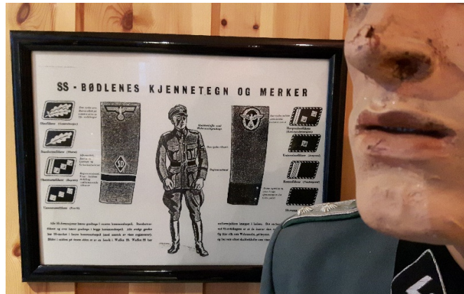
Forakten for menneskeverdet antar nye kjennetegn i vår egen tid.

Styret har en aktiv deltakelse i driften. Arbeidsmiljøet anses som godt.