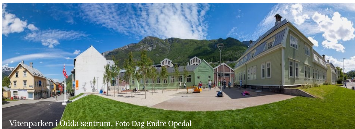
Vitenparken i Odda sentrum.