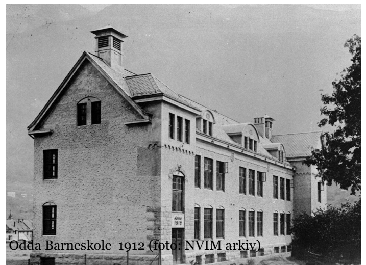
Odda Barneskole 1912