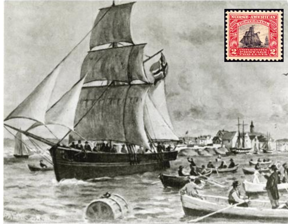
Restauration - 1825