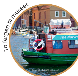
Ta fergen til museet