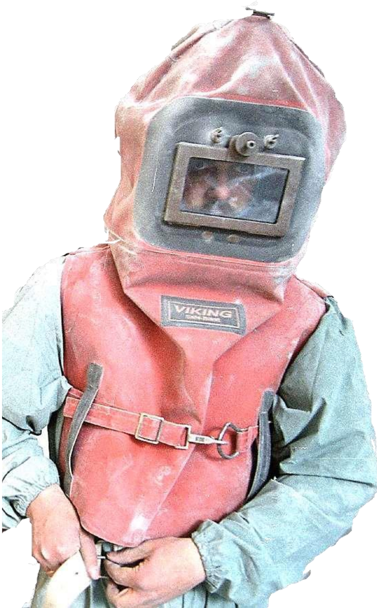
Frå restaureringa av Tyssedal kraftverk.