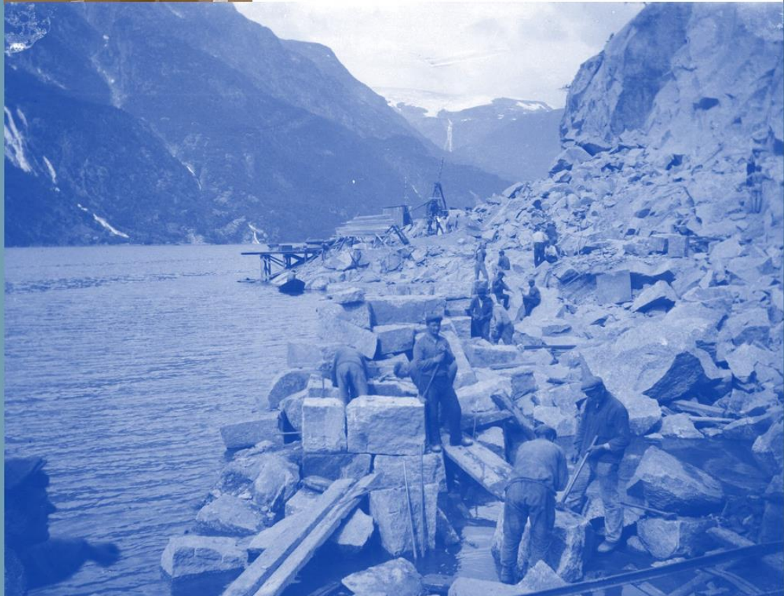
Vedteken i styret 10.12.24