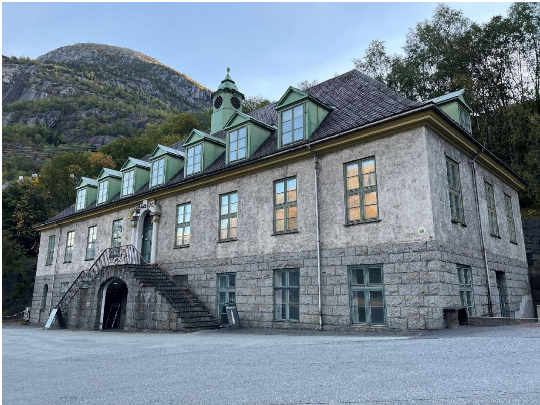
Kraftmuseet sin forretningsadresse og administrasjonsbygg er Naustbakken 7, og hovudarena for formidlinga vår er i Tyssedal.