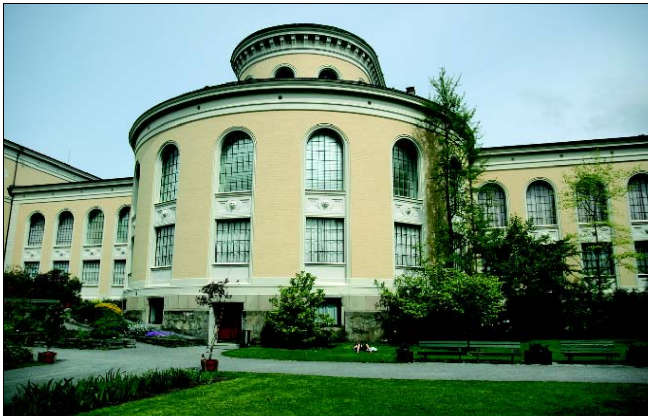
Figur 8.1 Naturhistorisk museum, Bergen Museum, bygget 1865.