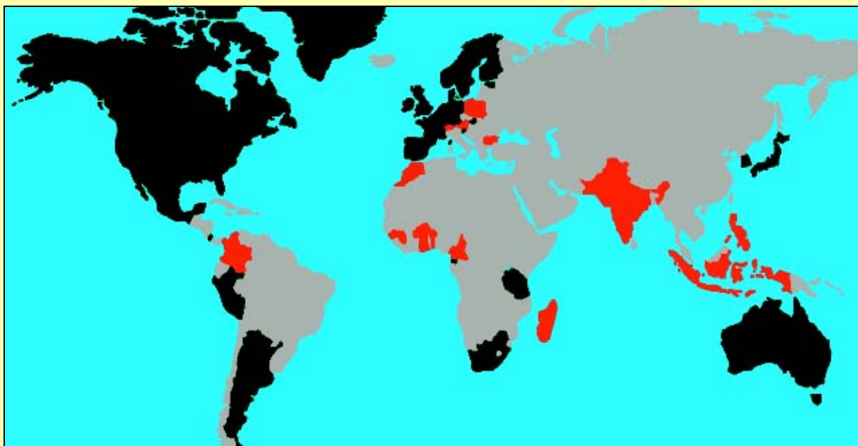
Figur 3.3 Kart over GBIF-stater. 28 stater (markert med grønt) er fulle medlemmer. 16 stater (markert med rødt) og 35 organisasjoner er assosierte medlemmer.

Den norske portalen, GBIF-Norge, har som oppgave å gjøre informasjon fra norske samlinger og andre kilder tilgjengelig for det internasjonale GBIF-nettverket. GBIF-Norge har forløpig lagt ut 2,5 millioner poster fra ni institusjoner og organisasjoner. Naturhistorisk museum driver den norske portalen. Se også gbif.no