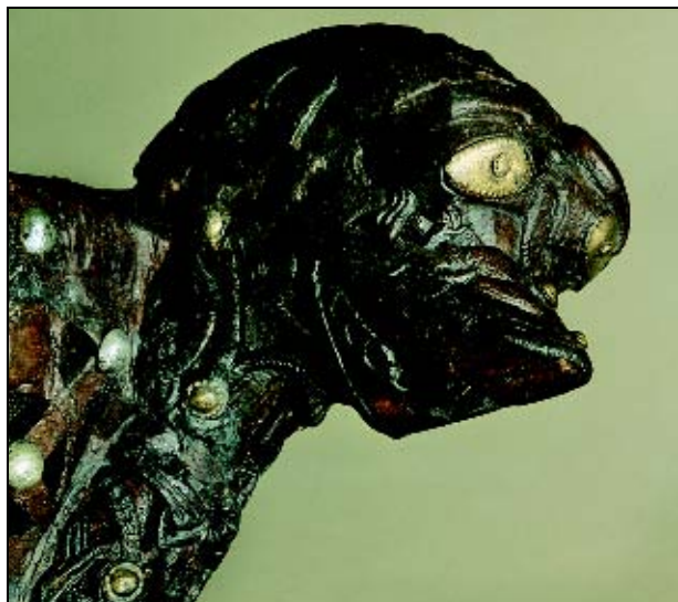
Figur 4.1 Dyrehodedetalj på slede fra Osebergfunnet, Oseberg, Tønsberg, Vestfold.

Som en oppfølging av Riksrevisjonens rapport har Kunnskapsdepartementet i samarbeid med