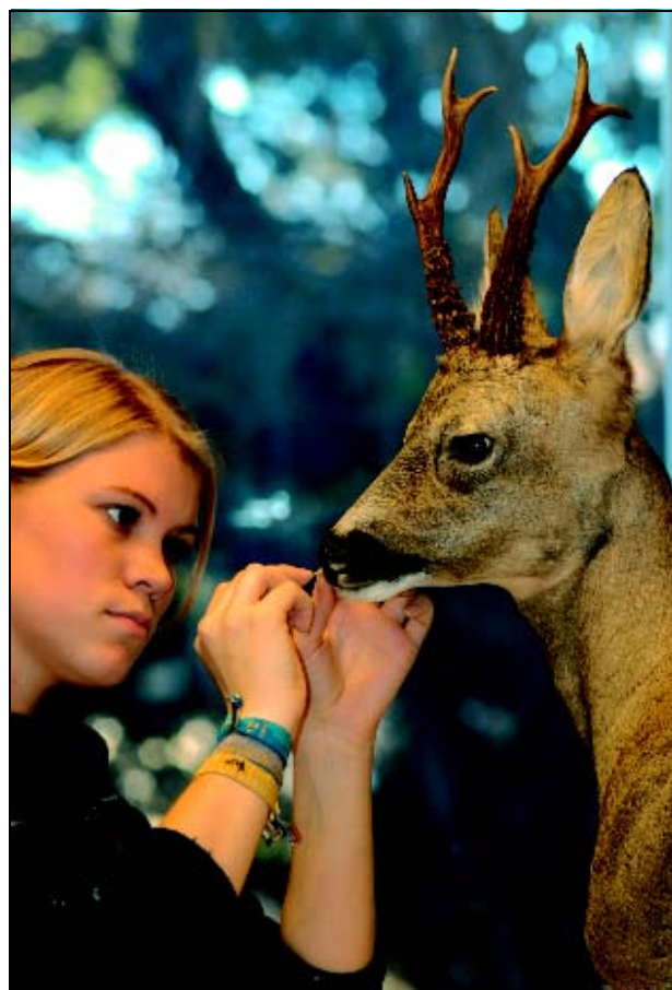
Figur 3.1 Taxidermistlærling preparer rådyr.

ABM-utvikling støtter utvalgets forslag om konsentrasjon omkring samlingene, taksonomi, kon-