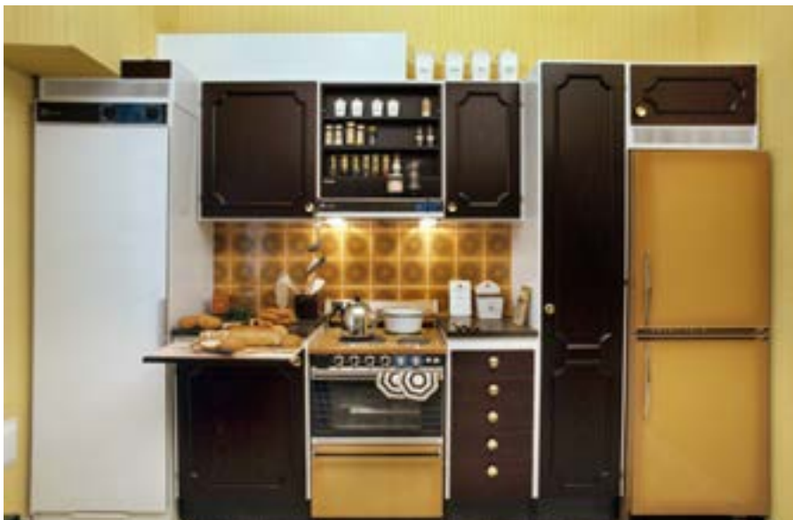
Moderne kjøkkeninnredning fra 1973. Hvitevarene har fått farger som matcher fliser og skapdører.