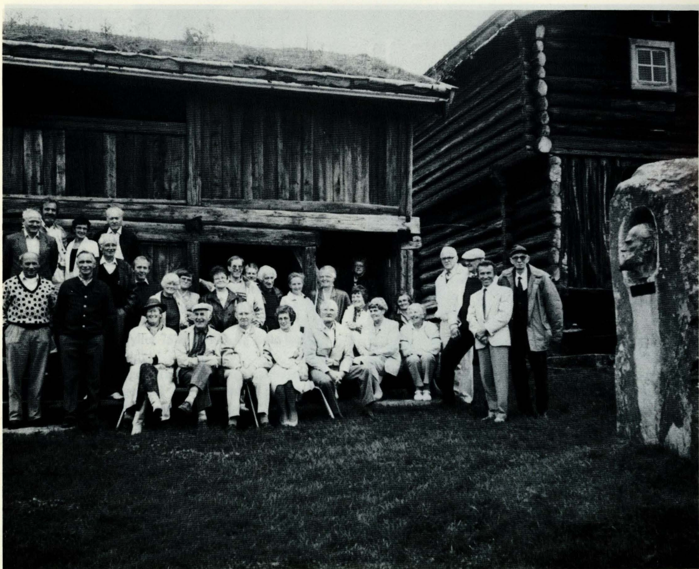
Samrådsmøtet samlet på Bull-museet, framfor loftet fra Bjønngarden. (62028).