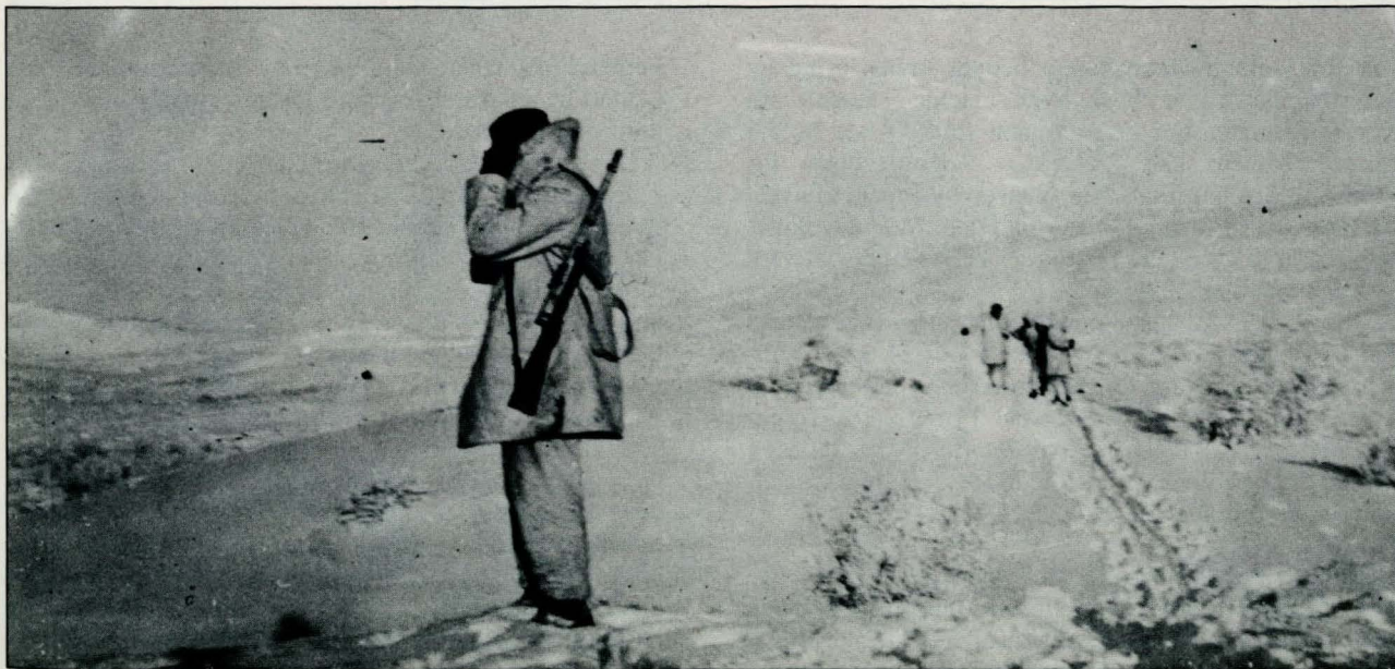
Vakt i Grøtådalen, 1944-45 (29265)