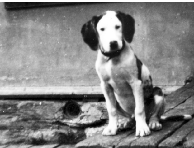
Hunden "Rex" venter på toget og kjøttkaka. (100499).