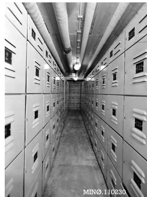
Nord-Østerdal slakteri Tynset, det første fryseboks-fryseriet med 275 bokser.

biler til andre slakterianlegg for slakting, spesielt til Rudshøgdaanlegget. Transporten er underlagt helt andre krav til dyrevelferd enn for vel 60 år siden. Det har vært en rivende utvikling både på godt og vondt også etter de gyldne 50-åra, da det meste dreide seg om å bygge og skape. På mange måter har det vært en evig slåsskamp for å beholde slakteriet som det var, men økonomien i dette har gjort at historien ble en annen, men arbeidsplassene er stort sett berget, selv om slakteridriften er historie.