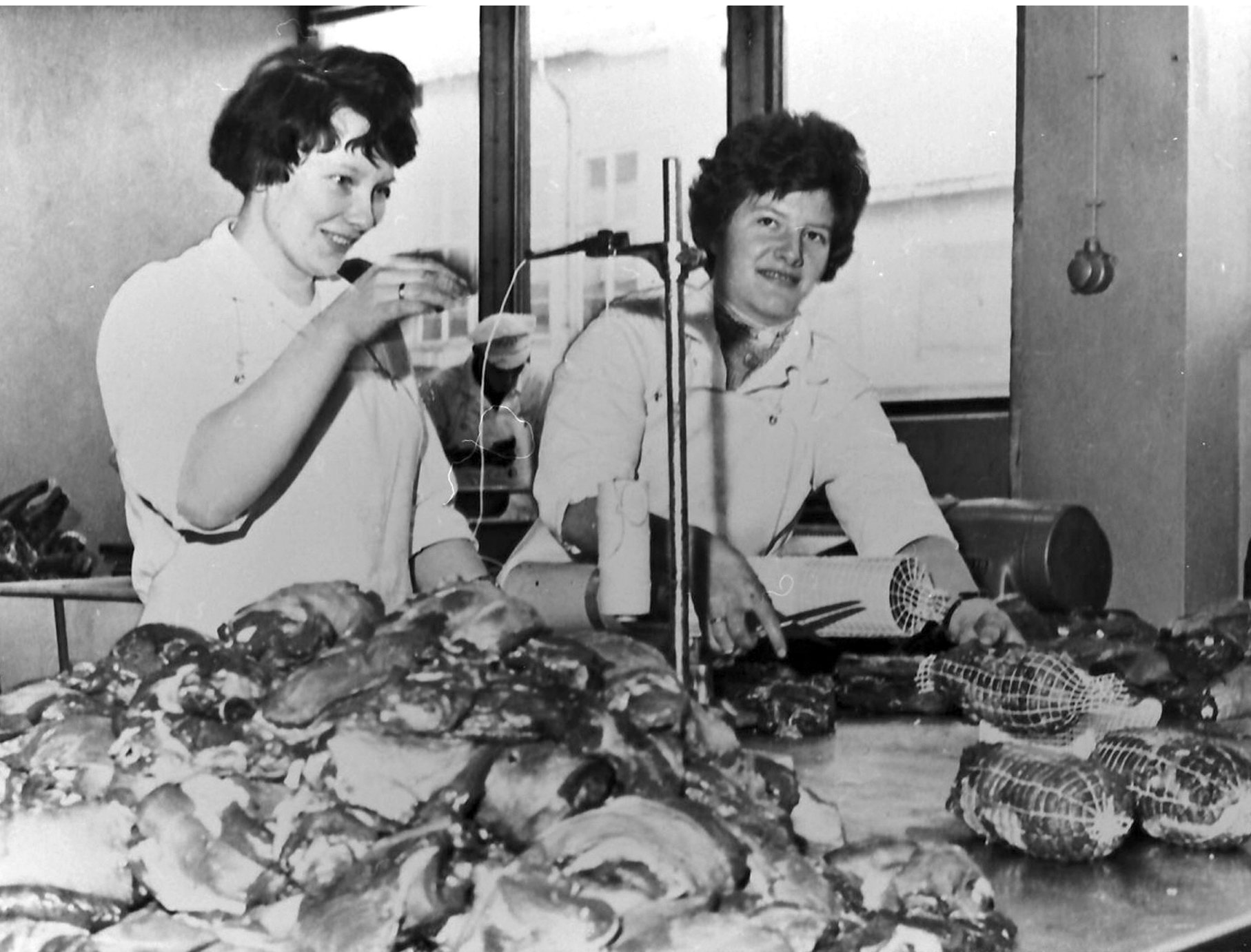
Damer pakker kjøtt på slakteriet. 1955