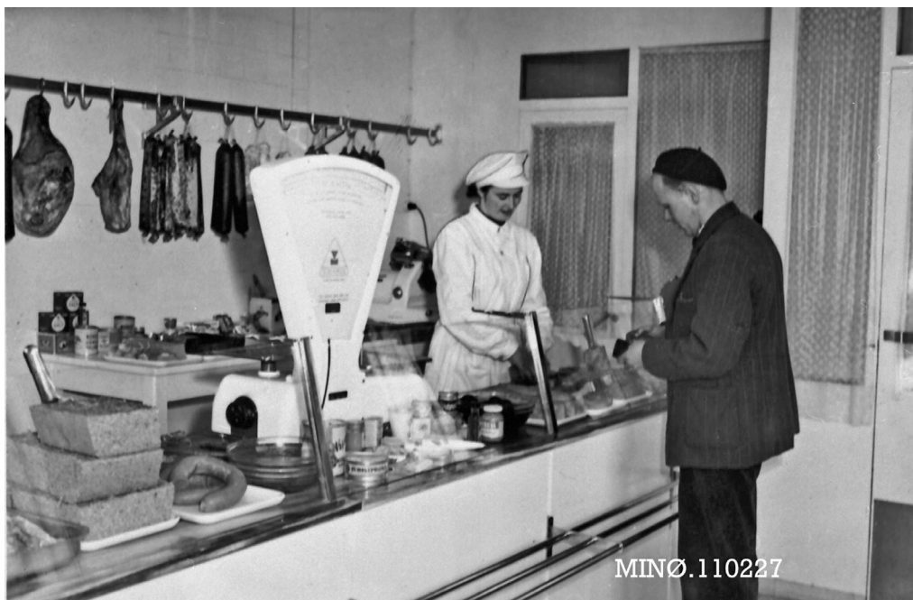
Nord-Østerdal slakteri, Tynset, kjøttutsalg i meieriets lokaler.

satte i 1960, (inkl. Røros) så det var ingen liten arbeidsplass på Tynset i disse årene. En attraktiv arbeidsplass var det også, for i 1950, da det skulle ansettes disponent, var det 53 søkere. Og det var på samme tid 68 søkere til en sjåførstilling, så det var virkelig behov for arbeidsplasser.