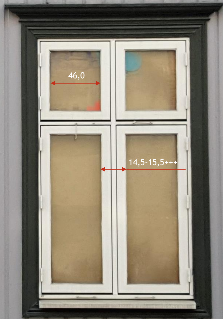
Klaringer 10-18 mm.