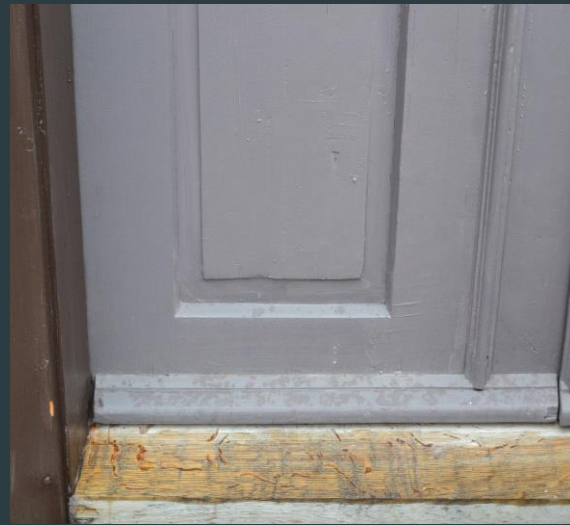
Emilies hus, Bymuseet Levanger.