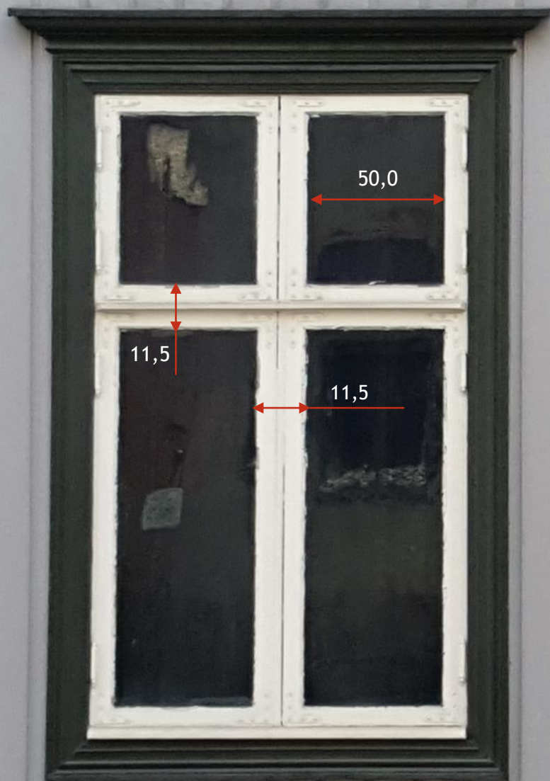
Små klaringer, 1-2 mm.

Forskjellene i rutestørrelsene og dimensjoner på treverket er tydelige på nye og gamle vinduer.