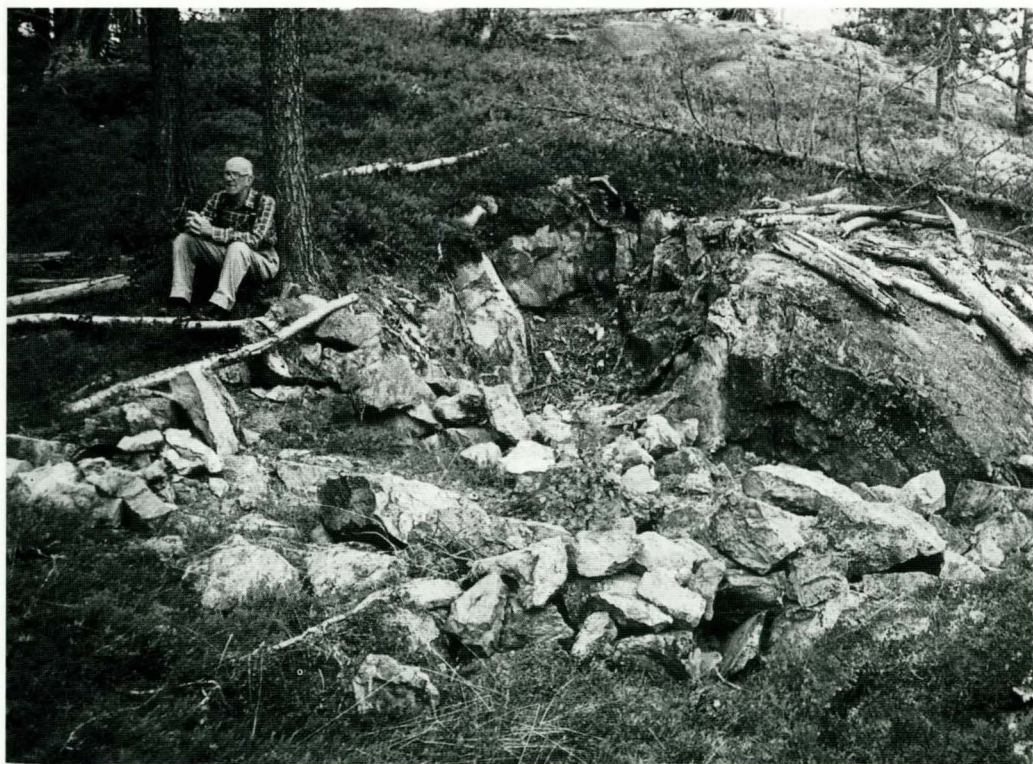
Råtne rester fyller i dag mye av hola.