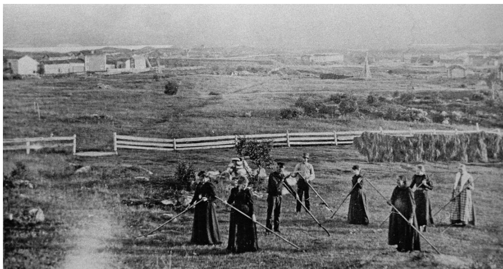
Slåttonn på Nygjelten. Her er både turister og hodøler i sving med river og ljåer. I bakgrunnen ser vi Gjelten.

ryper, var turistinntektene det som skaffa fjellbøndene kontanter. Regnskapsbøkene, som er oppbevart i Nygjelten, og som dekker mange år, dokumenterer dette.