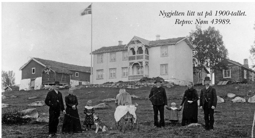
Nygjelten litt ut på 1900-tallet.