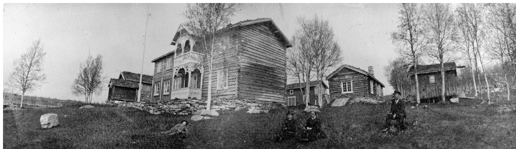
Turistene begynte å komme til Hodalen etter åpningen av Rørosbanen i 1877. I 1902 ble dette bildet tatt av vinterstua på Nygjelten. Den en-etasjes stua er påbygd både i lengda og høgda, og er klar til å ta i mot feriegjestene.