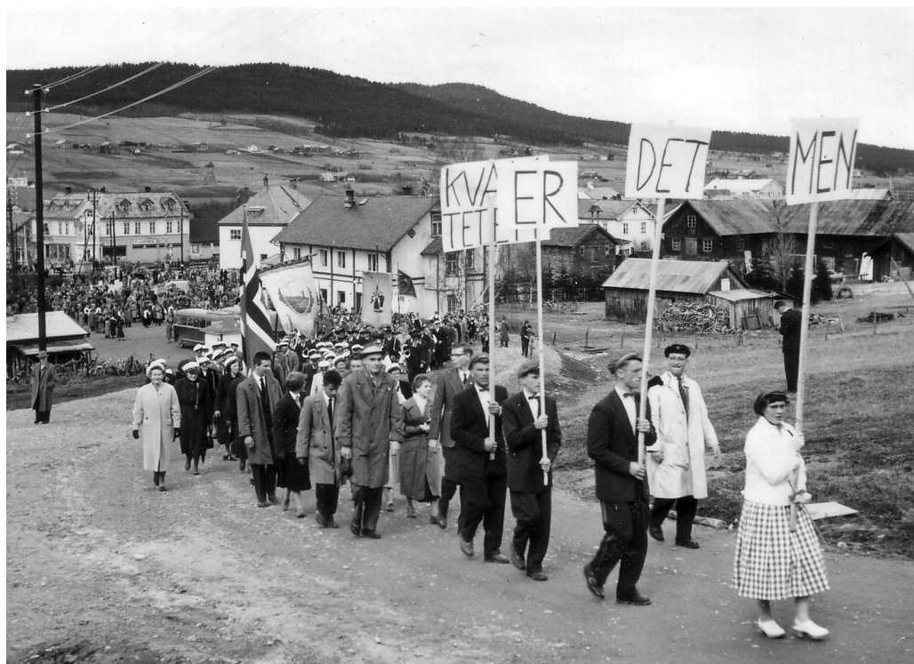
17.mai-toget på Tynset i 1958, for første gang med innslag av rødrudd. Parolen vår var at det ikke er kvantiteten som teller, men kvaliteten!

Men så en dag måtte det ugjenkallelige skje: Da ble det besluttet at vi skulle feire russetid! Pionerånden tok helt styring, og den ene idéen etter den andre tok form og ble realisert. Den 17. mai i