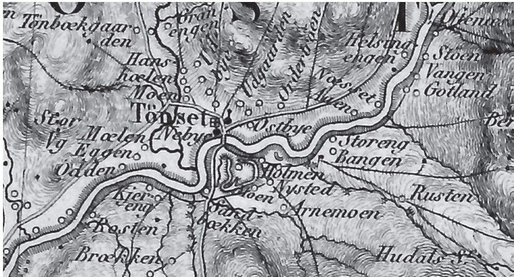
Kartutsnitt fra kart over Hedemarken Amt 1829, som viser veisystemet omkring Nebybrua. Kjerka er angitt med en firkant med kryss, men den sto ikke der i 1733. Gamlekjerka stod ovafor Prestegården.