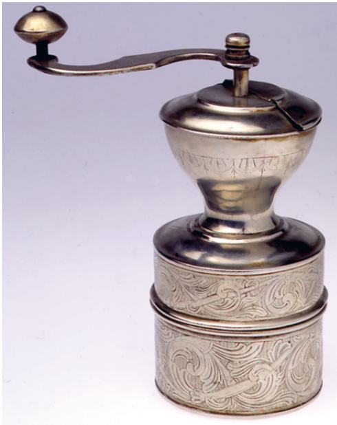
Kaffekvern laget av Stor-Karl.