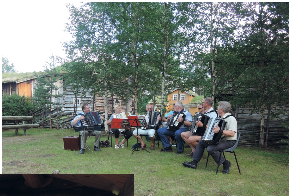
Tynset trekkspillklubb i Museumsparken.