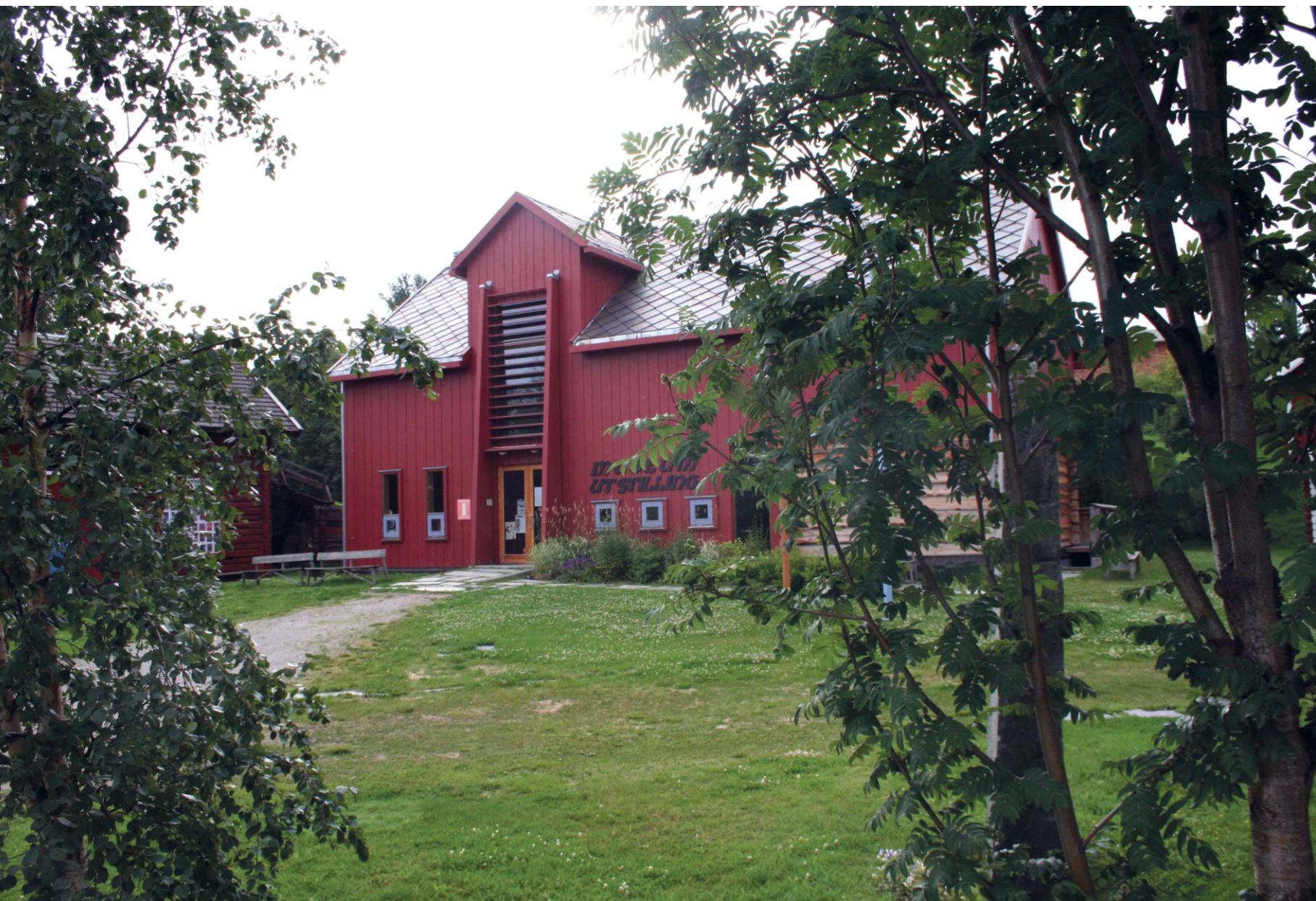
Ramsmoen. MINØ.120760.