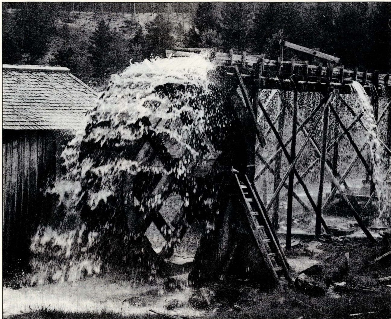
Saga i Mellombekken.

det til et lite uthus oppe i skogen, der de hadde sau eller gris. Men det var ikke store plassen, og proble-