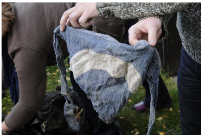
Ei venekote (penisvarmer), NBF på feltarbeid i 2012.

Ein del av registreringane som vart utført i 2011 har ikkje blitt innført i Primus. Dette fordi det ikkje er nok ressursar i forhold til arbeidsmengda instituttet har med dette. Ferdigstillinga vil skje i løpet av 2013.