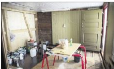
ETT AV ROMMENE: Noe arbeid gjønstr innendørs. Slik ser ett av tre rom ut. Mange har meldt sin interesse og ønsker å ta de i bruk.