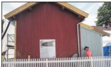
STALL BLE GARASJE: Stallen var for iten da doktoren fikk bil. Lassingene ble «vort» tilbygget til høyre.