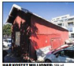
HAR KOSTET MILLIONER: Slik så uthuset ut før arbeidet startet. Prislaggen på restaureringsarbeidet har vært på 2,5 millioner.