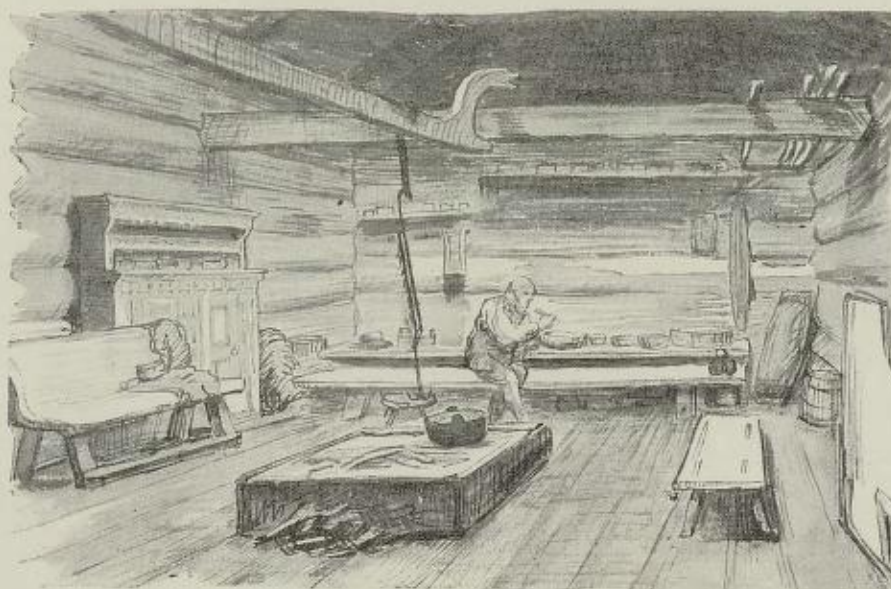
Interiør fra Sætersdalen. Efter A. Schneider ved Aug. Eiebakke.

Under foreningen med Danmark havned vore fortidslevninger i de kjøbenhavnske samlinger, og til Kjøbenhavn må vi i mange tilfælde søge den dag idag for at vinde sammenhæng