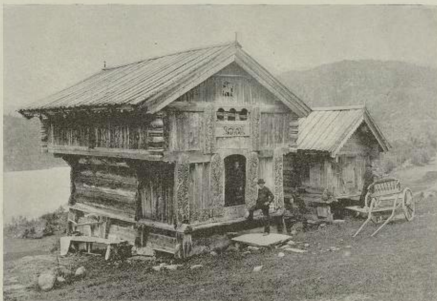
Fra Brelland i Høldalsmo, Telemarken.

Interessen for fædrelandets historie har altid været vågen hos vort folk. Lige fra sagaens tid og til den dag idag har fortidens liv og historie haft en egen evne til at gribe sindene. Ikke mindst kanske den indre historie, billedet af det liv som i helg og søgn har været ført i vort land ned igjennem tiderne, og af de livsvilkår som har præget dette liv i dets skiftende former. Hvordan vore fædre leved og stræved, hvordan de førte sin strid mod en streng natur og mod ublide kår, dyrked sin jord, eller drev sit