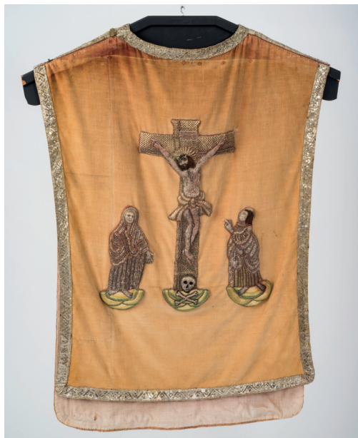
Messehagel (VMT.00527). Den har i en periode vært montert på et alter i Vingelen kirke. Baksiden av plagget viser en Golgatascene med Maria og Johannes på hver sin side av Jesus på korset.