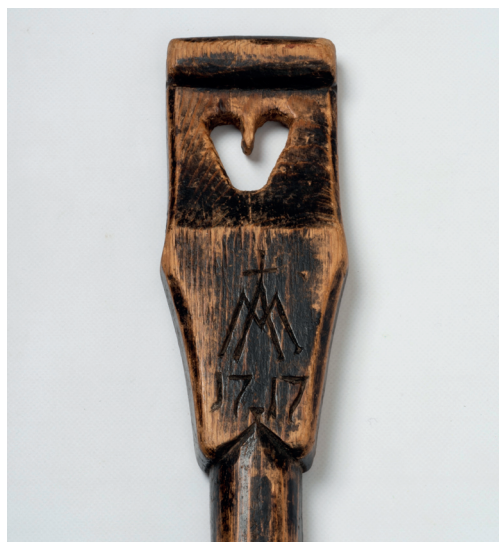
Detalj av spade (VMT.00025) brukt til jordpåkastelse. Baksiden av håndtaket på spaden har årstallet 1717 og et Mariamonogram skåret inn. Vingelen kirke- og skolemuseum har tatt Mariamonogrammet fra denne spaden som sitt kjenne-tegn.