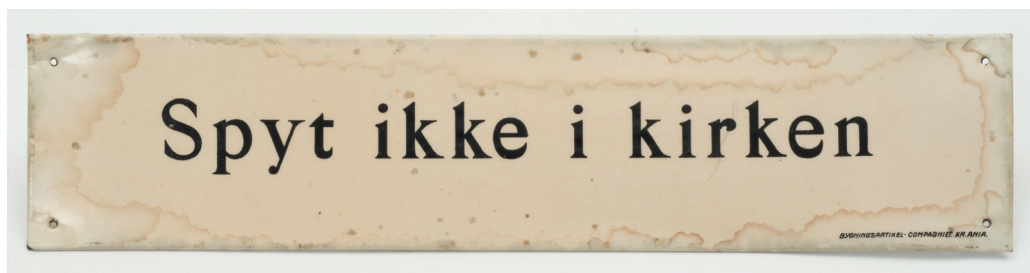
Skilt (VMT.00532) brukt i den nåværende kirken i Vingelen, trolig tidlig på 1900-tallet. Produsert ved Bygningsartikkel-compagniet i Kristiania. Regelen gjelder fremdeles.