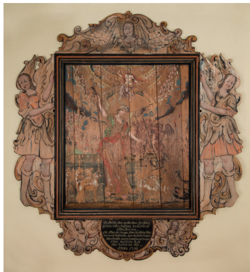
Tavle som viser dommens dag tilskrevet maleren Peter Andersson Lillie. Denne tavla hang på nordsida i koret i Trefoldighetskirka inntil denne ble revet i 1882.