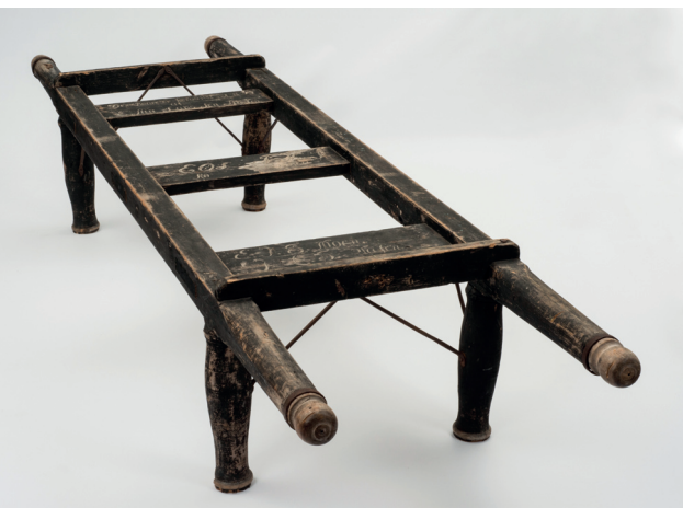
Bårebenk fra 1835 (VMT.00010) med navn og initialer til de som bekostet den skåret inn. Bårebenken ble trolig brukt til plassering av bære i en svalgang eller ute mens graven ble spadd.