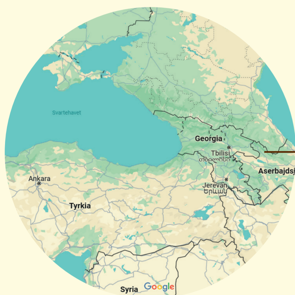
Den fruktbare halvmåne - Midtausen og Egypt

Dei eldste funna av linstoff er gjort i steinaldergrotter i dagens Georgia, ein fruktbar region mellom Svartehavet og Kaukasusfjella. Viltveksande lin vart her spunne, farga og knytt saman til tekstil - innpå 30.000 år før den fyrste bunadsskjorta i lin såg vart sydd her heime i steinrøysa.