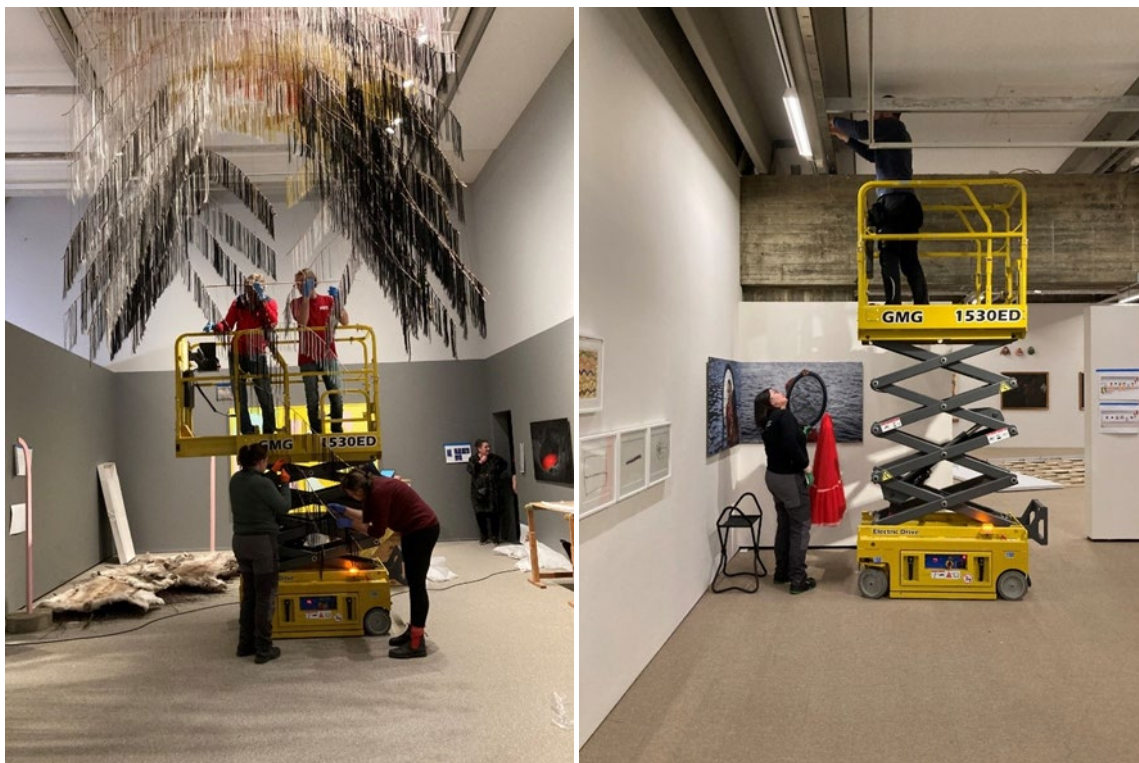
Oppheng av verket Crossing paths av Outi Pieski