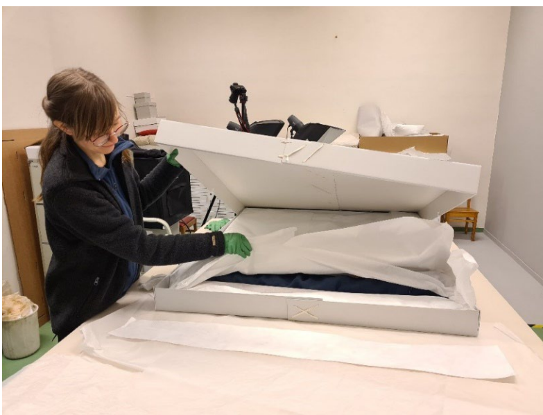
Pakking av tekstilar ved Osterøy Museum