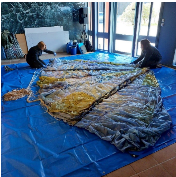
Tilstandsvurdering av fallskjerm frå Bjørn West museet