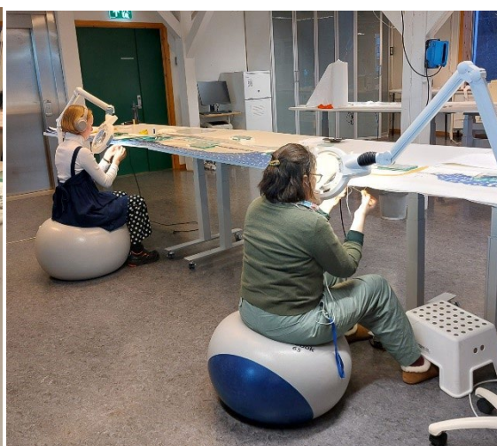
«Historija» får nytt opphengssystem